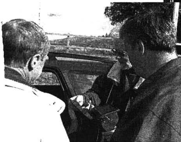
Ole i köptagen vid bytestunden på Hågelby